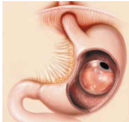
Das BIB-System positioniert im Magen

denen ein Arzt das Hilfsmittel zur Gewichtsreduktion oral